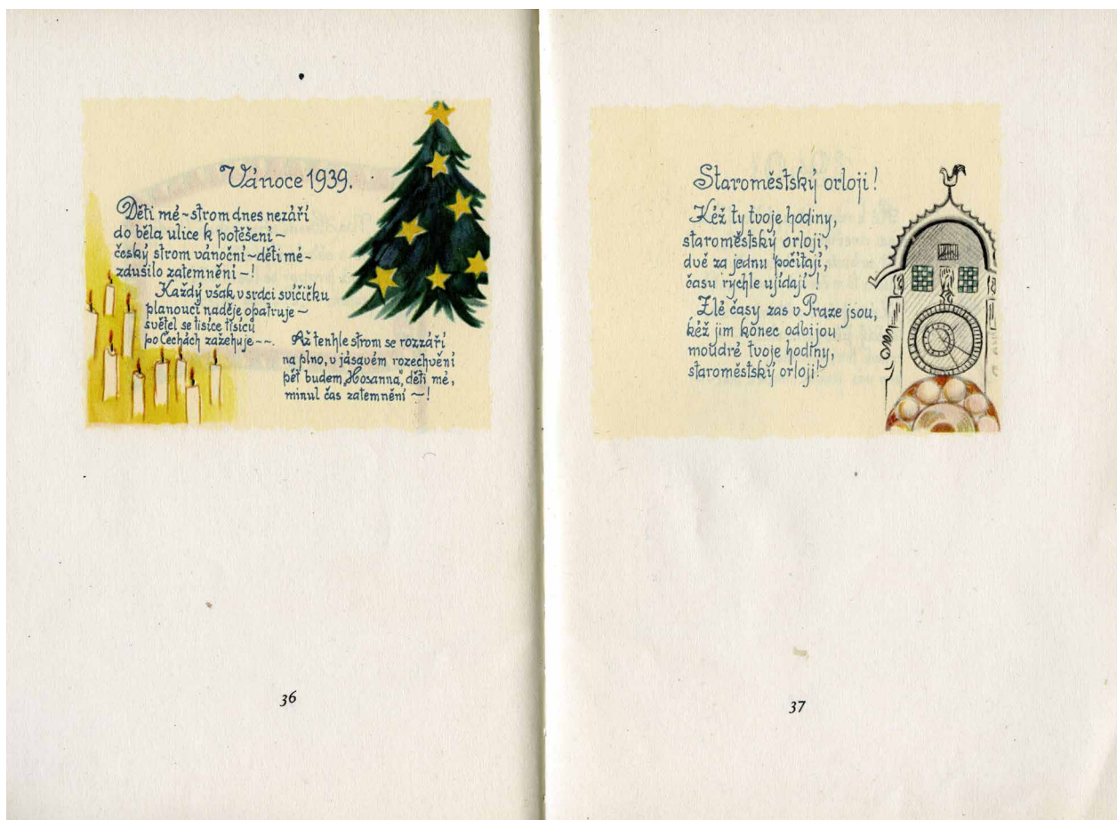
Obr. 1. Ukázka z knihy Jsme němi?

„Tato knížka se ocitla jednoho zimního dne r. 1940 na mém stole. Přišla za mnou z Prahy, cestou mně neznámou a našla mne. Čítala jsem v ní často a znali ji i naši londýnští přátelé. Všechny těšila velikou vírou člověka, který ji psal skrytě v okupované, drancované Praze a měl sílu těšit nadějí blízké i vzdálené. Dnes, kdy vím, že to dokázala ruka těžce pracující ženy, mohu jen uvítat vydání těchto veršů. Nechť jsou památkou těm, kteří je znají z ciziny a připomínkou těm, kteří žili zde ta těžká léta“.