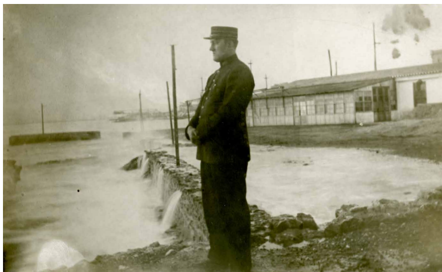
Obr. 8. V Athénách v roce 1930.