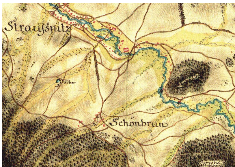
Obr. 4. Oblast pod Mlýnským vrchem na mapě 1. vojenského mapování z let 1764–1768, detail (ÖS-KA, 1st Military Survey, Section No. 28).

Kromě tohoto zápisu v deskách zemských existuje v českolipském archivu výtah ze zemského kvaternu z 1. poloviny 17. století, který obsahuje trhovou smlouvu z roku 1532 mezi Václavem a Prokopem z Vartenberka (obr. 3). 35/ Její obsah se však s textem obnoveného vkladu neshoduje. A zatímco deskový vklad obsahuje (pomineme-li lesy, rybníky a další součásti dílu) vsi Stračí (díl), Kozly, Robeč, Ledce, Písečná, Manušice a Okrouhlá, v původní trhově smlouvě jsou uvedeny pouze Manušice (dvůr), Písečná, Kozly a Robeč. Chybí zde tedy díl vsi Stračí (u Štětí), který však byl odprodán k Liběchovu. 36/ Proč chybí Ledce, víme dnes už také, protože nedávno bylo zjištěno, že Ledce, které jsou připomínány již od 15. století, byly od Lipského a Novozámeckého panství odprodány v roce 1605. 37/ Okrouhlá (něm. Schaiba) se nejprve připomíná v roce 1502 pouze jako „les Ssayba“ 38/ a tento pramen z roku 1532 je prvním dokladem existence vsi. Nedlouho předtím patrně vznikla.