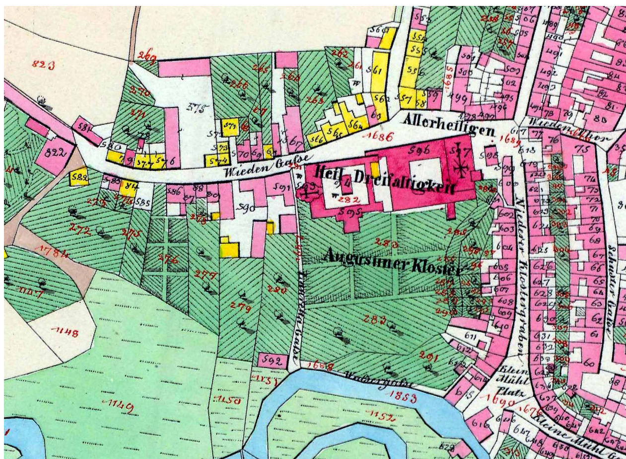
Obr. 1. Augustiniánský klášter v České Lípě na císařském otisku stabilního katastru města z roku 1843 [Mapový podklad: Archiválie Ústředního archivu zeměměřičtví a katastru, www.cuzk.cz ].

1409 se mluví o platech plynoucích farnímu kostelu „super allodio seu curia Petri Brenneri in platea dotis“, tj. z alodu (svobodného statku) neboli dvora Petra Brennera ve Věnné ulici. 21/ V roce 1502 se pak na dílu u Zádušní brány, který při dělení dostal Václav Berka z Dubé, uvádí na předměstí „plat ... s tiech zahrad ... kdež niekdy fforbergk byl“. 22/ Nelze říci, zda darovaný Rendelův dvůr je totožný s některým z uvedených statků v Zádušní ulici, ale víme, kde ležel, neboť náležel klášteru až do doby před 2. světovou válkou. Tak zvaný Rendelův dvůr se rozkládal na severní straně západního konce Zádušní ulice (dnes Paní Zdislavy), v místech budovy a dvora bývalého okresního úřadu čp. 418, postaveného v 70. letech 19. století (dnes tzv. Office Center neboli Kancelářský dům). 23/ Ještě v adresáři České Lípy z roku 1935 je jako majitel domu uvedena Vyučovací nadace Albrechta Eusebia hraběte Valdštejna, vévody Frýdlantského (Albrecht Eusebius Graf Waldstein Herzog von Friedland'sche Unterrichtstiftung“), již byl objekt přičten v roce 1880 po rozdělení Valdštejnovy nadace na část církevní a školní. 24/