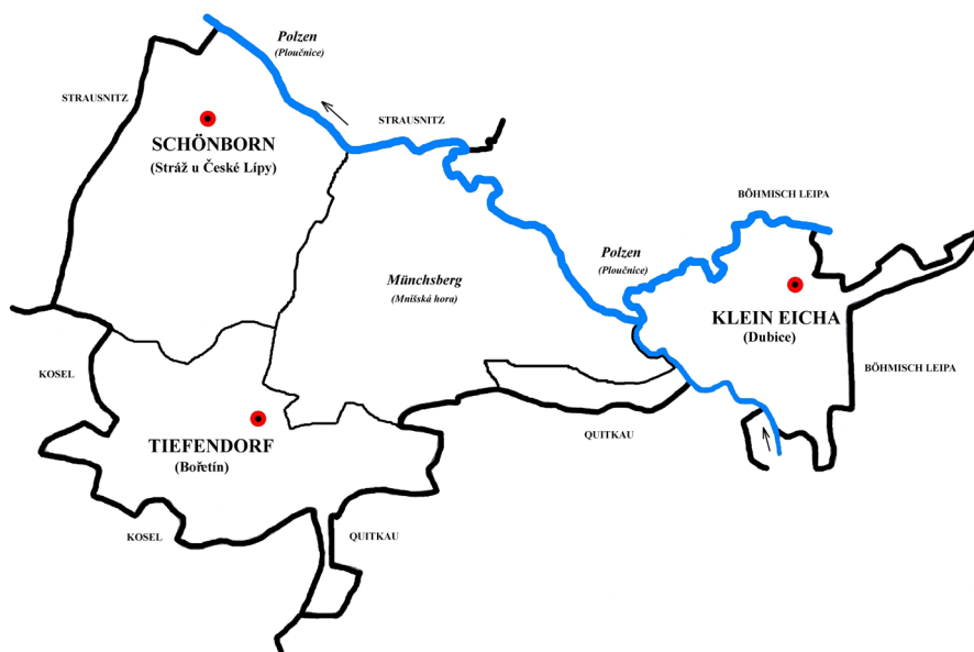
Obr. 2. Schematický plán panství Schönborn (Stráž u České Lípy) augustiniánského kláštera podle mapy stabilního katastru z roku 1843, tj. katastrální území Schönborn (kresba autor).

Město Lipá zakoupilo v roce 1389 od Hynka Berky Hohnsteinského věčný roční plat 8 kop a 27 ½ grošů pražských ve vsích Bořetín a Stráž ( in villa Tyfendorff et in villa Straze ) pro nadaci k nově založenému kostelu Panny Marie. 26/ Následující majitelé města tuto skutečnost respektovali, jak o tom svědčí například privilegium Adama a Zdislava Berky z Dubé z roku 1502, kterým potvrdili oba bratři měšťanům svého dílu všechna práva a privilegia včetně těchto platů ( uber das dorf Tifendorf und Straze ). 27/ I další zápisy vypočítávající vesnice na Novozámeckém panství z roku 1532 (resp. 1543) a 1570 potvrzují „ w Borzetinie a w Straži toliko panstwij bez platuow “. 28/ V urbáři Lipského a Novozámeckého panství z roku 1579 a 1619 se o Bořetíně píše „ Tato ves též sluší k městu Lypému, ale pán tyto lidi v své obraně má “ a o Stráži je uvedeno „ V Strážij jeden člověk. Tento člověk sluší k městu Lippému, ale pán má jej v své obraně “. 29/ Vzhledem k tomu, že platy z Bořetína směřovaly k lipským měšťanům, neuvádí urbář v Bořetíně ani počet, ani jména osedlých. Počet zdejších osedlých nalezneme až v berní rule z roku 1654: 4 + 1 sedlák, 2 chalupníci a 1 + 1 zahradník. 30/