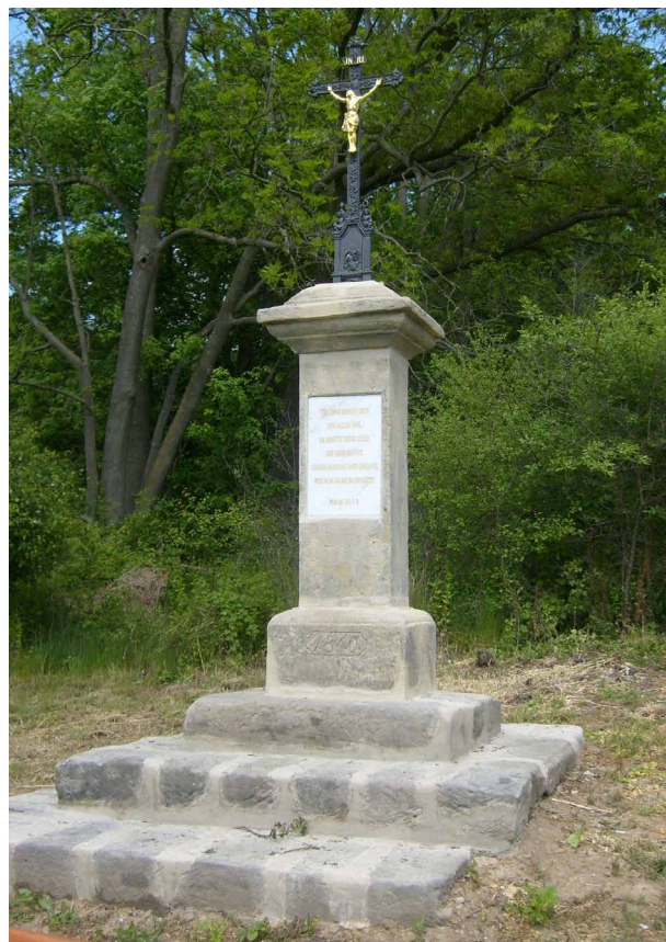
Obr. 4. Rané (okr. Česká Lípa), křížek restaurovaný v roce 2016, D. Janouch, J. Šmídek.