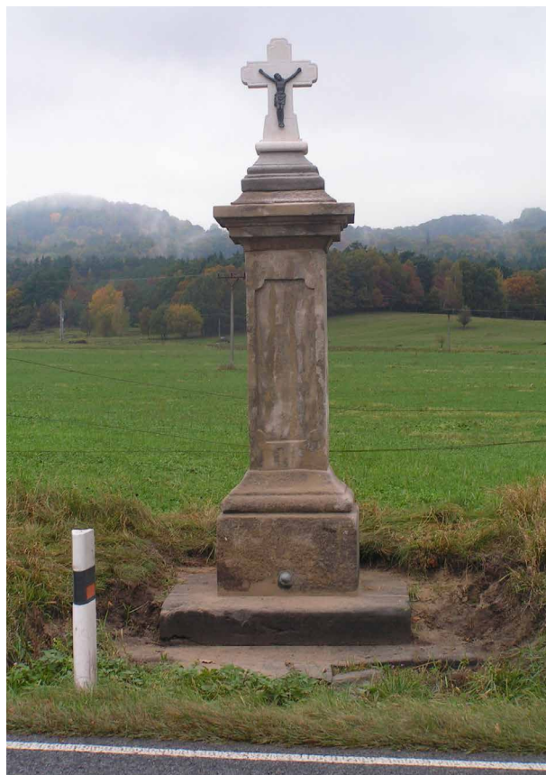
Obr. 6. Stvolínky (okr. Česká Lípa), křížek restaurovaný v roce 2016, D. Janouch, E. Míčková