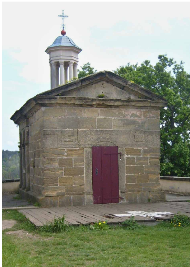
Obr. 1. Ostré (okr. Litoměřice), vybudování nové lucerny kaple Božího hrobu, 2013, D. Janouch, J. Šmídek, J. Kalina, O. Škach.

Po levé straně obce Medonosy mezi obcemi Brocno a Chcebuz byl již v roce 2011 obnoven Mariánský sloup. Původní vlastní dříví části sloupu byl zničen natolik, že nebylo možné přistoupit k jeho rekonstrukci, a tak byl sloup vysekán a nahrazen sloupem novým. Základní architektura sloupu však byla zachována, zrestaurována a na vrchol hlavice osazen výdusek sochy Panny Marie. Ve stejné lokalitě byl zrestaurován křížek na cestě u obce Radouň a v roce 2012 následovala práce na restaurování křížku v obci Chcebuz. Neopatrností řidiče traktoru byl Mariánský sloup u Brocna rozbořen a v roce 2016 muselo dojít k jeho nové opravě. Při restaurování a manipulaci těžkých