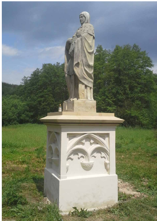
Obr. 2. Medonosy (okr. Mělník), socha sv. Ludmily restaurovaná v roce 2016, D. Janouch, P. Dufek, J. Šmídek.