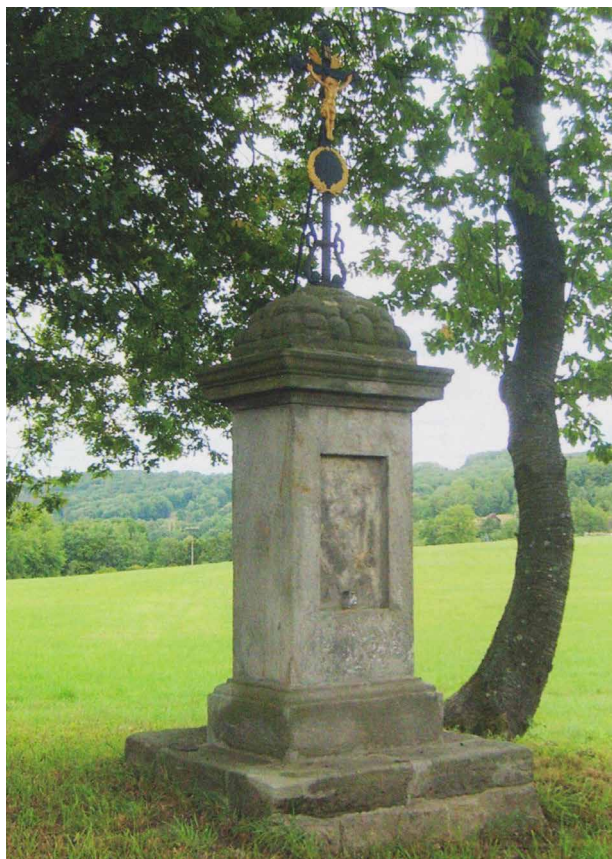
Obr. 5. Taneček (okr. Česká Lípa), křížek restaurovaný v roce 2016, D. Janouch, J. Šmídek.

Na Českolipsku probíhaly v roce 2016 práce na restaurování křížků na mýtině u obce Rané a na polní cestě za obcí Taneček (obr. 4, 5). Zatímco kamenné části křížku u obce