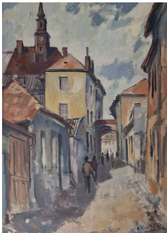
Obr. 2. Česká Lípa, Panská ulička, olej na plátně, 1981 (maj. autorky).

V 60. letech spolupracoval s architekty na prostorových realizacích v architektuře. V roce 1981 vytvořil např. sgrafito v nové jídelně Narexu, v roce 1985 se účastnil výzdoby polikliniky v České Lípě či kina v Novém Boru. Koncem 80. let namaloval fresku na kůru v kostele sv. Nikolý v chorvatské Ostrvici.