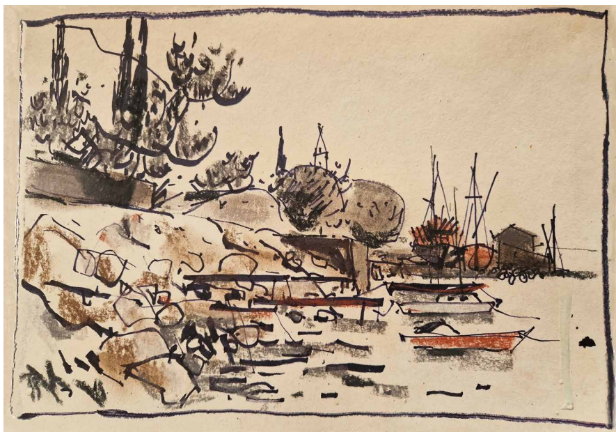
Obr. 5. Pobřeží v Chorvatsku, fix a barevná křída, 80. léta 20. století (maj. autorky).

Jeho malířské dílo je rozsáhlé, na počátcích nalézáme krajiny ztvárněné akvarelem či kvašem. V 60.–70. letech tvoří veduty inspirované kubistickou vícehledovostí s náznaky struktur olejovým pastelem, kde výraznost pastelů tlumí grafitovým práškem. Největší část tvoří olejomalby zátiší, kytic a zejména krajinných motivů Českolipska, Orlických hor a dalších oblastí. Samostatnou kapitolou jsou obrazy vzniklé ve střední Dalmácii, vlastně v okolí Omiše. A právě zde zaznamenala jeho malba výrazný zlom. Horké slunce jihu jeho tvorbu prosvětlo.