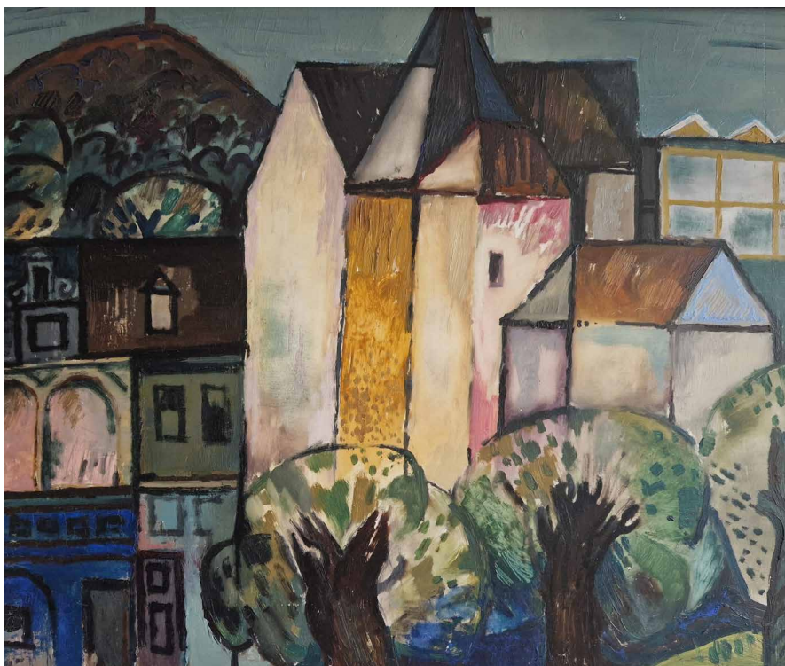
Obr. 4. Česká Lípa, olej na desce, 1970 (maj. autorky).

Jeho malířské dílo je rozsáhlé, na počátcích nalézáme krajiny ztvárněné akvarelem či kvašem. V 60.–70. letech tvoří veduty inspirované kubistickou vícehledovostí s náznaky struktur olejovým pastelem, kde výraznost pastelů tlumí grafitovým práškem. Největší část tvoří olejomalby zátiší, kytic a zejména krajinných motivů Českolipska, Orlických hor a dalších oblastí. Samostatnou kapitolou jsou obrazy vzniklé ve střední Dalmácii, vlastně v okolí Omiše. A právě zde zaznamenala jeho malba výrazný zlom. Horké slunce jihu jeho tvorbu prosvětlo.