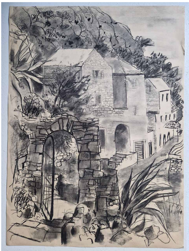
Obr. 6. Pohled z Mirabely na Omiš v Chorvatsku, kresba uhlím na papíře, 80. léta 20. století (maj. autor-ky).